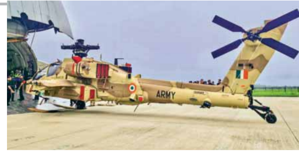
अपाचे को गाजियाबाद के एयरबेस पर उतारा गया

एच-64ई अपाचे अटैक हेलिकॉप्टरों की अंतिम खेप भारत पहुंचने पर अमेरिकी दूतावास ने इसका स्वागत किया। दूतावास ने कहा कि भारत-अमेरिका रक्षा साझेदारी की तहत किए गए वादे को पूरा किया गया है। इन हेलिकॉप्टरों की डिलीवरी में पहले कई बार देरी हुई थी।