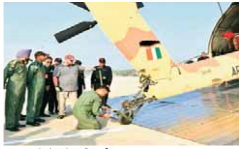
पूजन करते सेना के अधिकारी

भारतीय सेना की युद्ध क्षमता में मंगलवार को एक और ऐतिहासिक अध्याय जुड़ गया। अमेरिका ने एच-64ई अपाचे अटैक हेलिकॉप्टरों का दूसरा और अंतिम बैच भारतीय सेना को सौंप दिया है। इस डिलीवरी के साथ ही सेना को अपने सभी 6 अपाचे लड़ाकू हेलिकॉप्टर मिल गए हैं, जिससे देश की सीमा सुरक्षा और आक्रामक क्षमता को नई धार मिली है। अमेरिका से आए ये तीन अत्याधुनिक अपाचे हेलिकॉप्टर गाजियाबाद स्थित हिंडन एयरबेस पर उतरे। इसके बाद इन्हें राजस्थान के जोधपुर में स्थित 451 आर्मी एविएशन स्क्वाड्रन में शामिल किया जाएगा, जहां से ये रणनीतिक रूप से महत्वपूर्ण इलाकों में तैनात किए जाएंगे। इन अपाचे हेलिकॉप्टरों को भारतीय सेना ने सनातन हिंदू परंपरा के अनुसार विधिवत पूजन के साथ अपने बेड़े में शामिल किया। मंत्रोच्चार