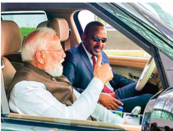
इथियोपिया के पीएम खुद कार चलाकर पीएम मोदी को एयरपोर्ट ले गए