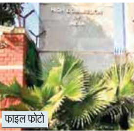
एजेसी नई दिल्ली

भारत ने ढाका स्थित भारतीय उच्चायोग की सुरक्षा को लेकर गंभीर चिंता जताते हुए बांग्लादेश के उच्चायुक्त को तलब किया है। यह कदम हालिया धमकी और 'सेवन सिस्टर्स' को अलग-थलग करने वाले बयान के बाद उठाया गया, जिससे दोनों देशों के कूटनीतिक हलकों में हलचल तेज हो गई है। भारत ने बुधवार को ढाका स्थित भारतीय उच्चायोग की सुरक्षा को लेकर गंभीर चिंता जताते हुए बांग्लादेश के उच्चायुक्त एम. रियाज हमीदुल्लाह को तलब किया।